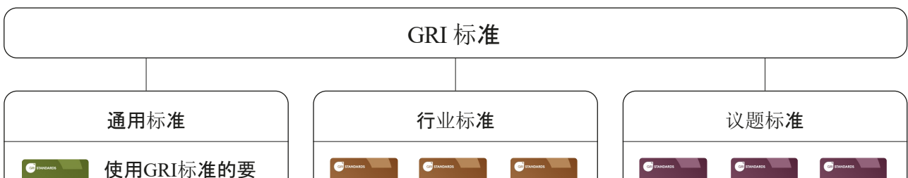
图1.GRI标准：通用、行业和议题标准

议题标准包含一系列披露项，用于组织报告与具体议题有关影响的信息。组织使用 GRI 3 确定实质性议题清单，并据此采用议题标准。